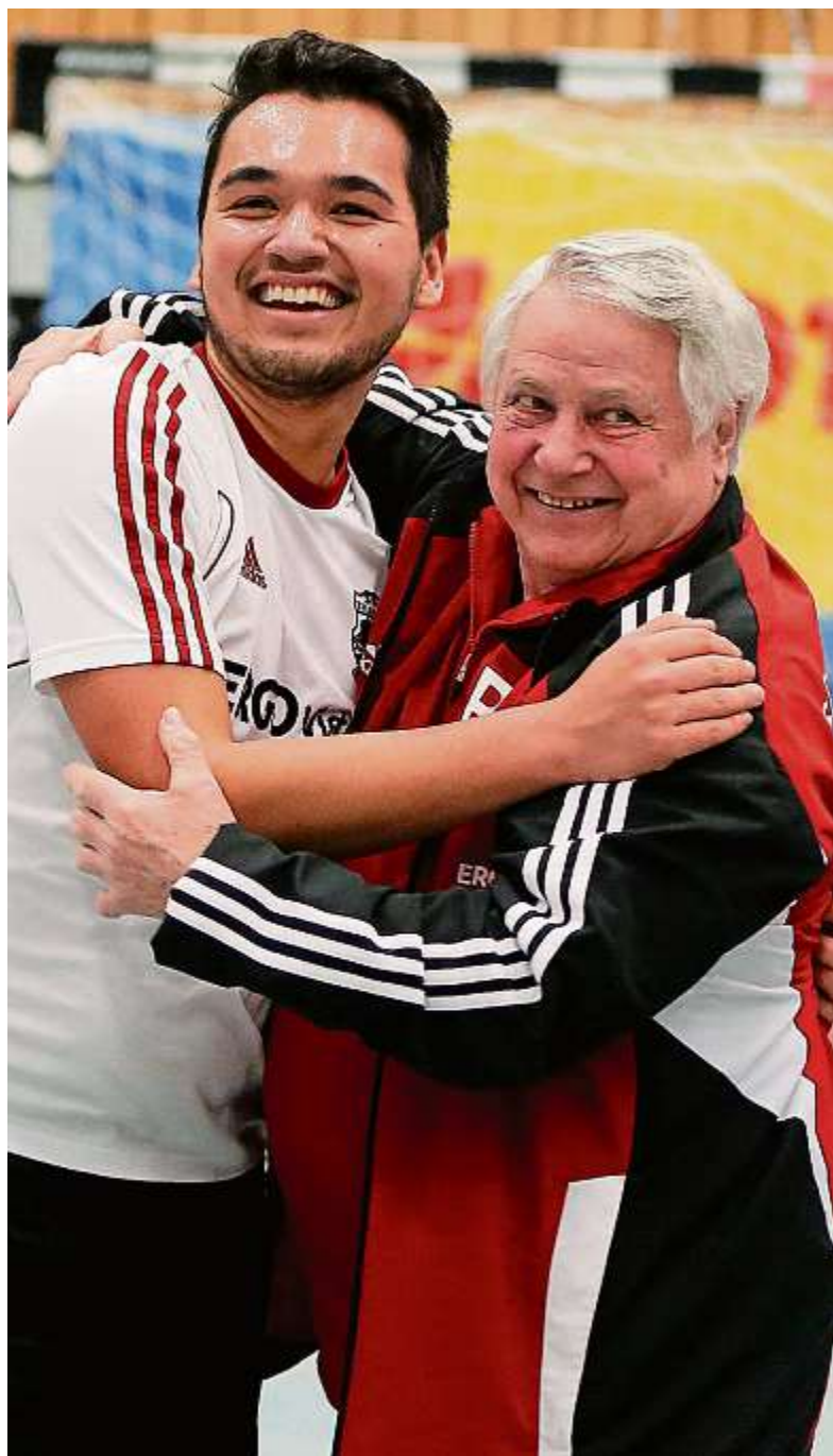
Großer Jubel herrschte bei der SG Walhalla.